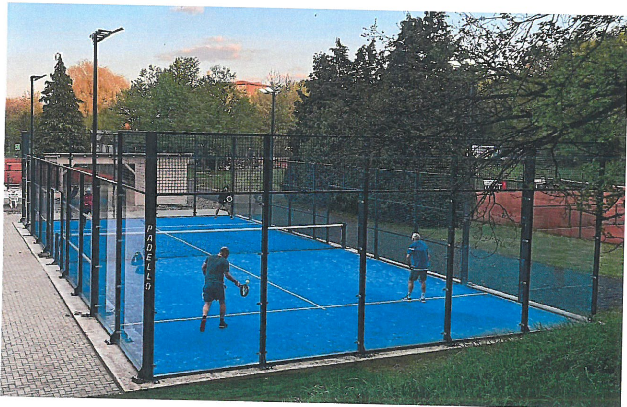
Padel-Anlage auf dem Gelände des TV Tiebreak.

18.06.2024 , 05:00 Uhr · 5 Minuten Lesezeit